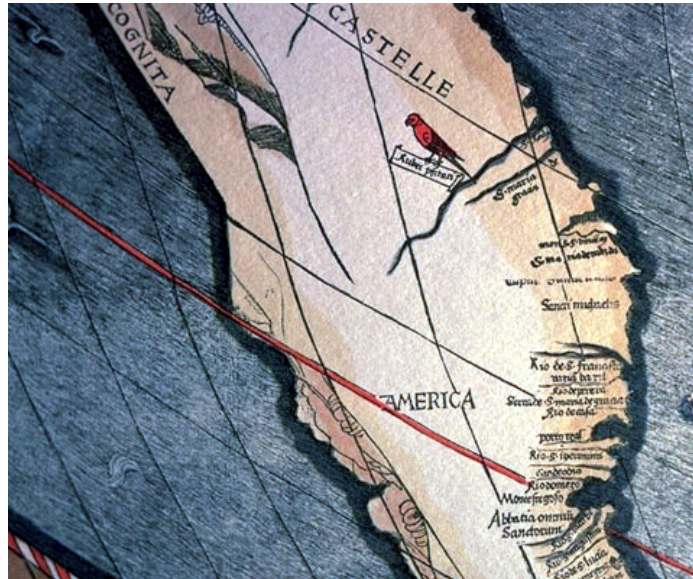
Obrázek 7.3.1. Detail Waldseemüllerovy mapy z roku 1507

O neznámou pevninu projevilo záhy zájem i Portugalsko, i jeho první kontakt s Amerikou však byl víceméně náhodný. Výprava do Indie klasickou cestou kolem Afriky, kterou vedl Pedro Álvares Cabral (kolem 1467 – asi 1520), přistála 22. 4. 1500 u východního pobřeží Brazílie a položila tam základy příští portugalské Jižní Ameriky.